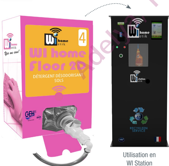
Utilisation en WI Station