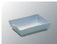
Bac de pré-imprégnation

Performant : imprégnation homogène des franges grâce à ses 256 trous en forme d'entonnoirs qui permettent une répartition équilibrée du liquide.