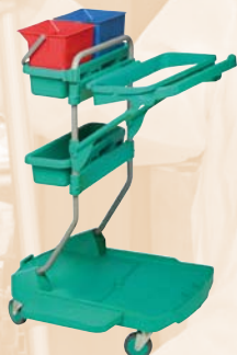
CHARIOT LIVRE SANS PRESSE, SANS SAC ET SANS COUVERCLE KIT PORTE SAC (à commander séparément)