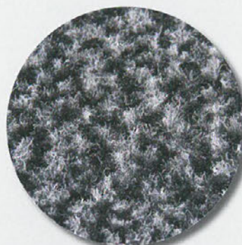
Fibres de polypropylène mouchetées