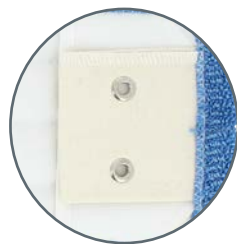
POCHES + LANGUETTES + OEILLETS