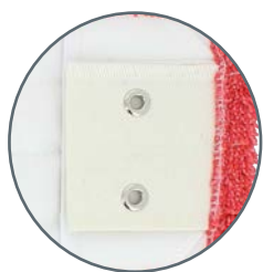
POCHES + LANGUETTES + OEILLETS