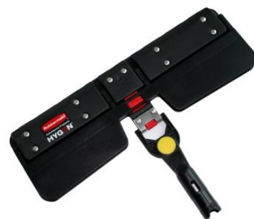
1791676 Plastic Léger Durable