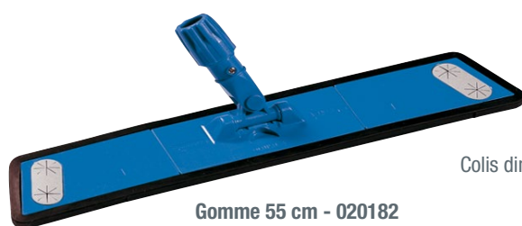
Gomme 55 cm - 020182