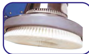
Brosse à laver Code : 026102 Brosse à fibrer Code : 026191