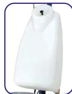
Réservoir Code : 026104

Service aux professionnels Parc d'Activité des Cortots 12, rue des Cortots 21121 Fontaine les Dijon Tél. : 03 80 57 07 07 Fax : 03 80 57 07 00 E-mail : geh@geh.fr