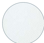
Blanc 013603 - 013604