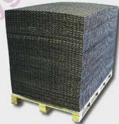
Possibilité de livraison sur palette