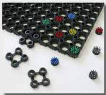
Brosses + jonctions