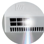
ÉCLAIRAGE DE LA ZONE DE SÉCHAGE

1 Unité logistique (nombre d'unités par colis).