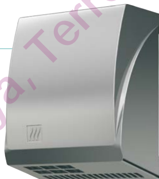
REF 8 11 414 Master automatique chromé brossé UL 1 : 4