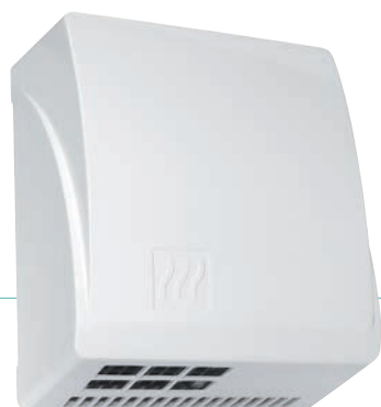
REF 8 11 413 Master automatique blanc UL 1 : 4