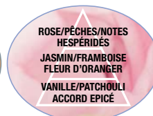
FLEUR DE LIN